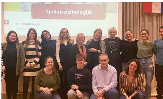
Veljača: Tjedan Psihologije u Istri: Predstavljanje psihoterapijskih pravaca