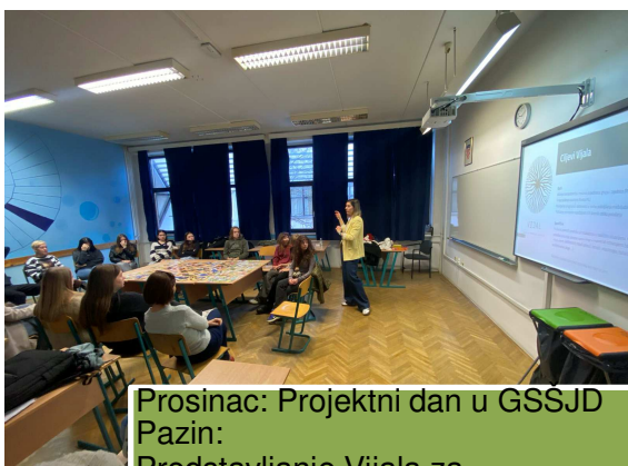
Prosinac: Projektni dan u GSSJD Pazin: Predstavljanje Vijala za srednjoškolce