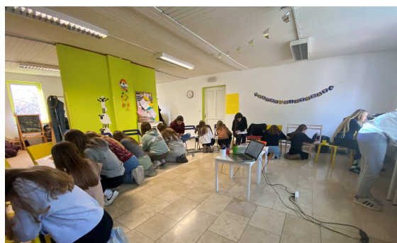
Tijekom godine: Radionica za igrači ŽOK Pazina: "Odnosi među igračicama u ekipi"