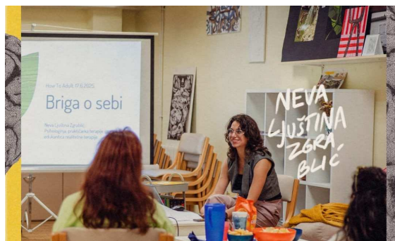
Lipanj: "How to Adult - briga o sebi" u suradnji s Centrom za mlade Alarm Pazin